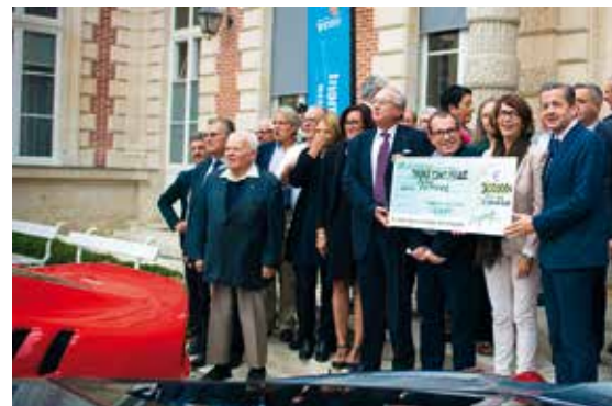
Remise de chèque de Sport et collection, le jeudi 7 septembre 2017