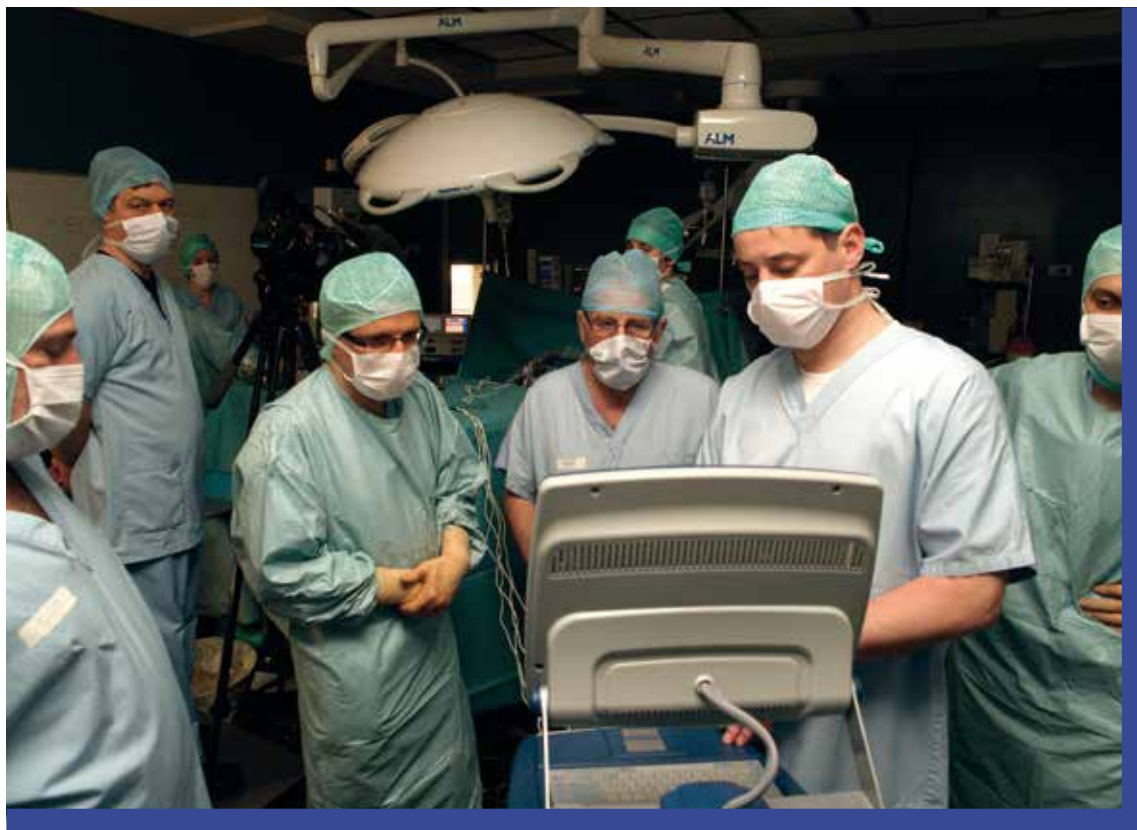
L'équipe médicale contrôle l'électroporation dans le traitement du cancer du pancréas avec le Nanoknife.