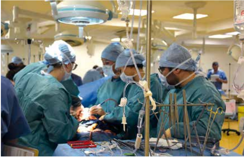
Les chirurgiens s'entraînent au prélèvement d'organes en conditions quasi réelles sur Simlife.