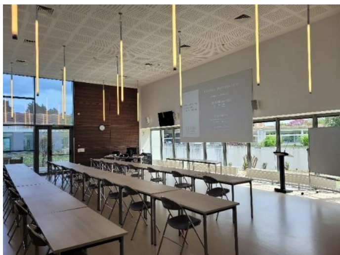
La salle de cours