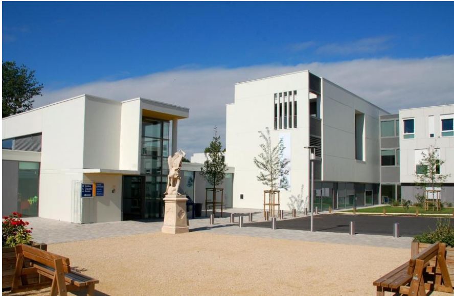
Le pavillon Maillol